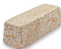
SIOLA KOMBI SAND