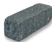
SIOLA KOMBI ANTHRAZIT