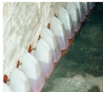
PCI Bohrlochsperr wird mindestens 24 Stunden lang aus PCI Injektionsbehältern injiziert.