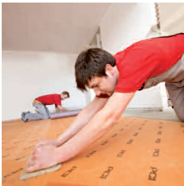
PCI Pecilastic U einlegen und fest andrücken, z. B. mit einem Holzbrett oder Hartgummi-Fugbrett.