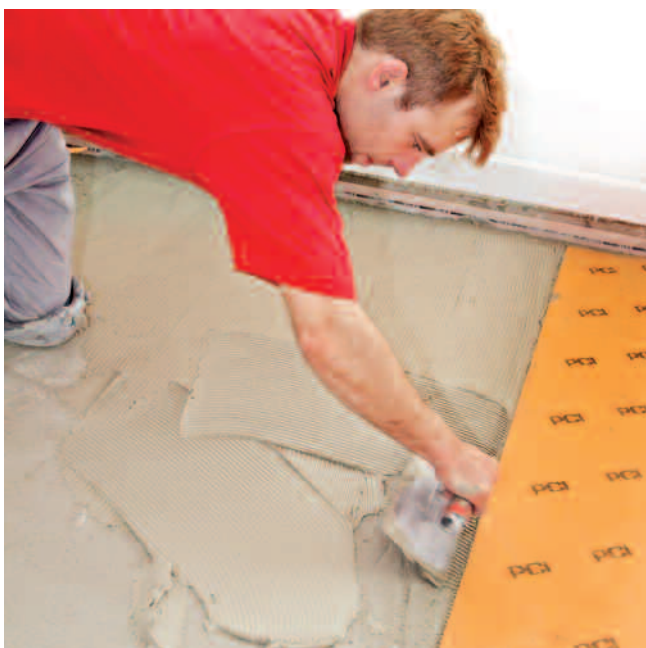
Auf dem vorbereiteten Untergrund PCI Nanoflott light oder PCI Rapidflott aufkämmen...