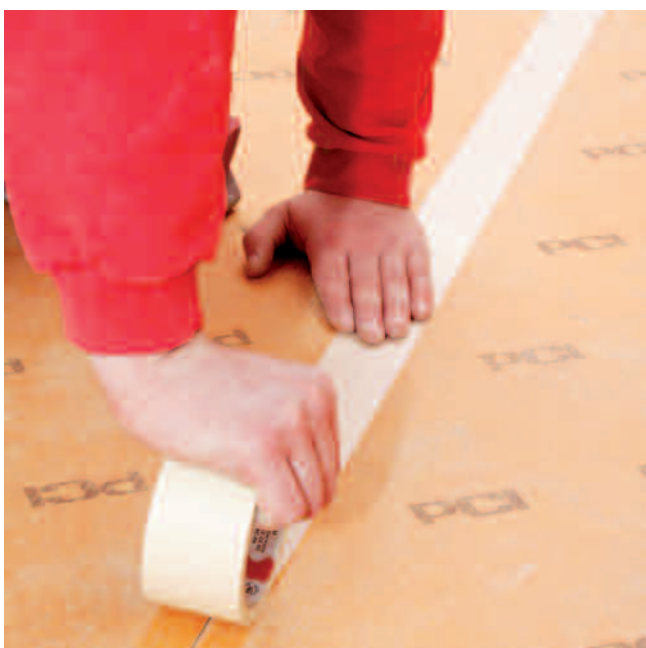
In Trockenbereichen die Stöße mit Kreppband sichern, in Bereichen mit Feuchtigkeitsbelastung mit PCI Pecitape abdichten...