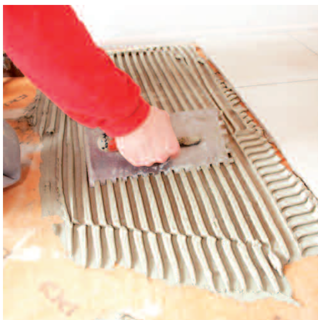
und mittels PCI Nanoflott light oder PCI Rapidflott den neuen Keramikbelag verlegen.