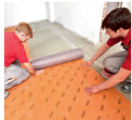
Keramische Beläge können auf der Abdichtungs- und Entkopplungsbahn PCI Pecilastic U funktionssicher verlegt werden.

FLIESEN & PLATTEN Leserwahl Produkt des Jahres 2011 1. Platz