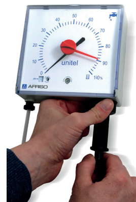
Mittels Pumpe unten rechts an der Anzeige mehrmals pumpen bis Luft im Erdtank aus dem Schlauch austritt.