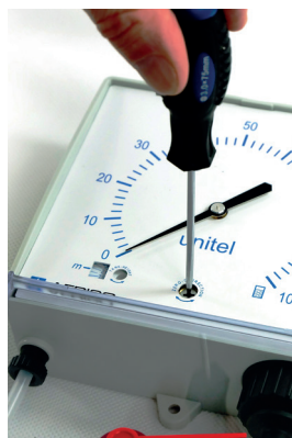
An der Anzeige den Zeiger mit der entsprechenden Schraube Nullen.