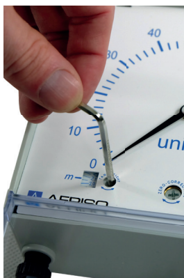
An der Anzeige die maximale Füllstandshöhe im Behälter einstellen.

Der Messschlauch muss auf die richtige Länge zugeschnitten werden (ggf. ein Gewicht am Schlauch befestigen).