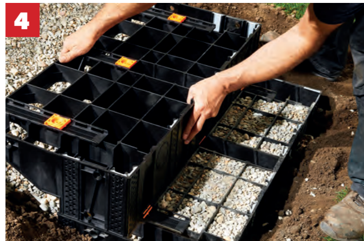
Die weiteren Stufen in die Schienen schieben ...