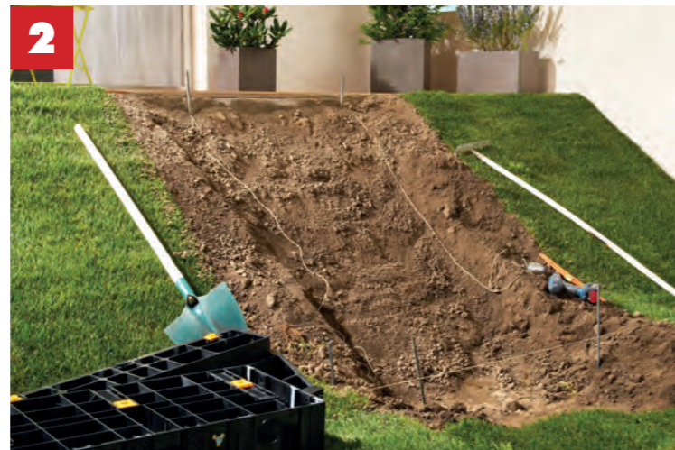
Vorbereitung des Grundstücks: Den Boden graben und die Oberfläche ebenen.

In 8-9 Schritten mit Schaufel, Wasserwaage, Schraubenzieher und MODULESCA zur praktischen Gartentreppe!