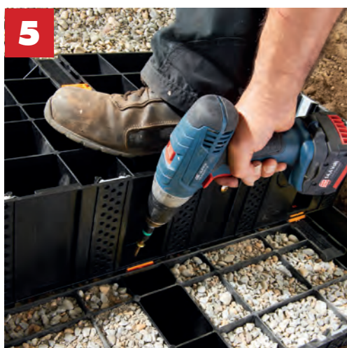
... und verschrauben ...

ermitteln und durch die Anzahl der Stufen teilen. Das ergibt die Trittfläche jeder Stufe.