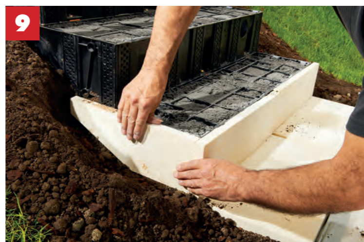
... mit dem gewünschten Material verkleiden.