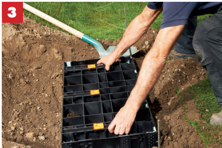
Die erste Stufe ausrichten, 1% Gefälle nach vorne wegen Wasserablauf