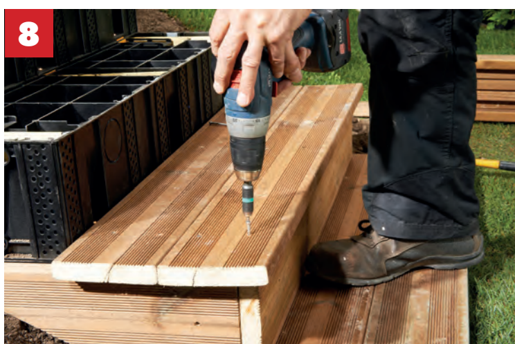
Die verfüllten Stufen ...

Abmessungen: 20 cm (B) x 42,4 cm (T) x 17 cm (H)