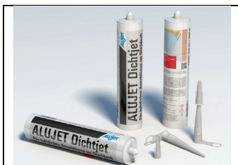
Abb. 1: ALUJET Dichtjet 310 ml