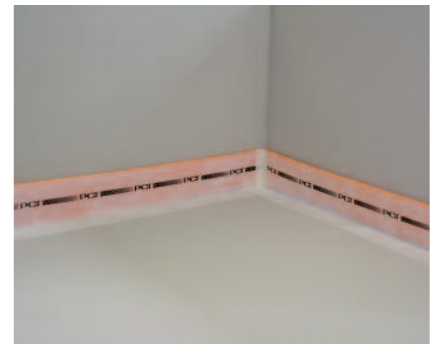
Mit dem selbstklebenden Randdämmstreifen PCI Pecitape Silent können Schallbrücken einfach und wirkungsvoll verhindert werden.