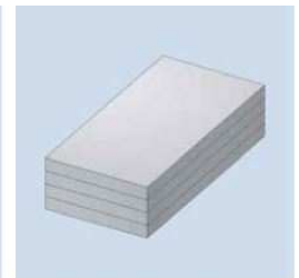
Gipsplatten-Streifen 4-fach verleimt

Vertrieb: BENZ GmbH & CO. KG Baustoffe, Auwiesen 4, 74924 Neckarbischofsheim Tel.: +49 7263 649-0, www.benz-baustoffe.de