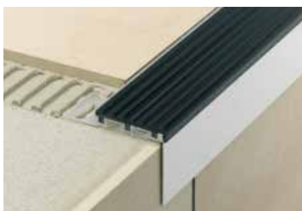
Schlüter®-TREP-B mit Schlüter®-TREP-TAP