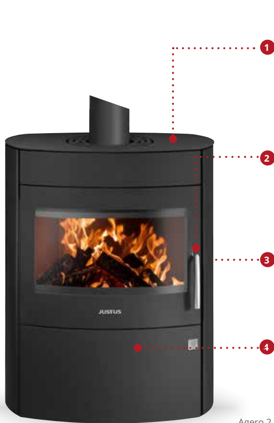
Agero 2.0 Stahl Schwarz